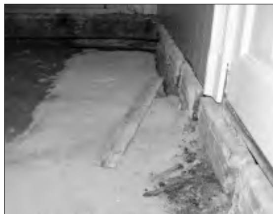
Fundering onder de vloer van de Zeeuwse Koorschool te Goes.

In samenwerking met de gemeente Goes verrichtte de SCEZ op 30 maart archeologische waarnemingen onder de vloer van de Zeeuwse Koorschool in Goes, na een vondstmelding van een fundering door medewerkers van de gemeente. De fundering kwam tevoorschijn bij het verwijderen van een houten vloer in de kamer van de vroegere pastorie, gelegen aan de Singelstraat tegenover de Grote Kerk. Aan deze zijde van de Singelstraat stonden in de zeventiende eeuw diverse woonhuizen, alle van katholieke eigenaren of in eigendom van de rooms-katholieke parochie. In 1696 zijn twee huizen tot een schuilkerk ingericht. Ten zuiden daarvan stond een huis dat eerder schuilkerk was, het huis dat oorspronkelijk eigendom was van de kunstschilder Eversdijck. Toen dit pand zijn functie van schuilkerk in 1696 verloor is het verbouwd tot woonhuis voor de stadspastoor. Aan de noordkant van de tweede schuilkerk stond een oud woonhuis. Op die plek, ter breedte van drie huizen, werd in 1815 een nieuwe roomse kerk gebouwd. Bij de nieuwbouw brak men de oude schuilkerk en het oude woonhuis af. De gevonden fundering is vermoedelijk die van de kerk van 1815.